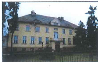
Września: Dawna Szkoła Mleczarska