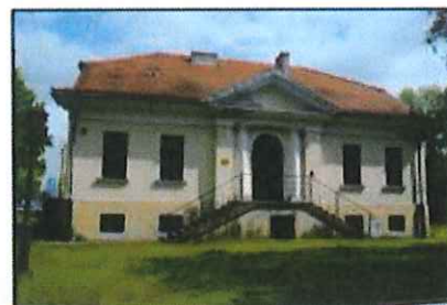
Kołaczkowo: Budynek dworski, czyli oficyna

Budynek z 1820 r. wchodzący w skład zespołu parkowo-pałacowego. Budynek o formach klasycystycznych. Parterowy, na wysokim podpiwniczeniu, nakryty dachem naczółkowym. Wejście główne na osi ujęte przyściennymi kolumnami. Nad wejściem trójkątny ryzalit.