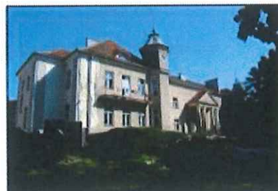
Zieliniec: Pałac

Na terenie parku znajduje się pałac, nie wpisany do rejestru zabytków, zbudowany na pocz. XX w. w stylu eklektycznym. Obecnie piętrowy. Elewację frontową zdobi czterokolumnowy portyk. Jednak bryła budynku została zszpecona przebudowami.