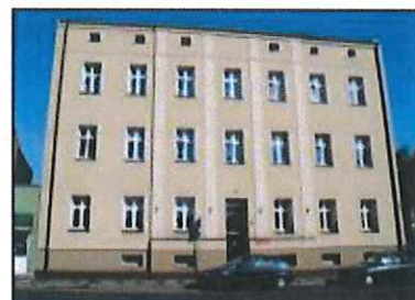
Września: Dawny Ośrodek Zdrowia przy ul. 3 Maja

Obiekt w strefie ochrony konserwatorskiej historycznego układu urbanistycznego miasta. Kamienica z początku XX w. Pierwotnie jako budynek piętrowy kryty dachem namiotowym. W I. 30. XX w. nadbudowano drugie piętro. Po II wojnie światowej pełnił rolę ośrodka zdrowia.