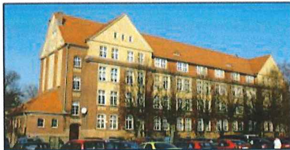
Września: Blok żołnierski w zespole koszar wojskowych (1) obecnie Zespół Szkół Zawodowych nr 2 im. Powstańców Wielkopolskich

Obiekt w strefie ochrony konserwatorskiej historycznego układu urbanistycznego miasta. Budynek powstał w 1910 r. jako blok żołnierski. Obiekt monumentalny, na rzucie litery E, dwupiętrowy, kryty wysokim dachem namiotowym. Cechuje go surowość, prostota i oszczędność w detale architektoniczne.