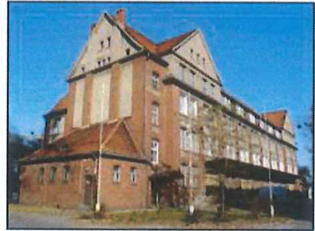
Września: Blok żołnierski w zespole koszar wojskowych (2)

Obiekt w strefie ochrony konserwatorskiej historycznego układu urbanistycznego miasta. Budynek powstał w 1910 r. jako blok żołnierski. Obiekt monumentalny, na rzucie litery E, dwupiętrowy, kryty wysokim dachem namiotowym. Cechuje go surowość, prostota i oszczędność w detale architektoniczne.