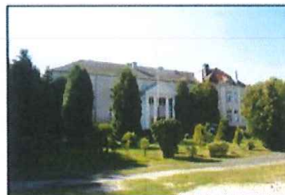
Zieliniec: Park krajobrazowy