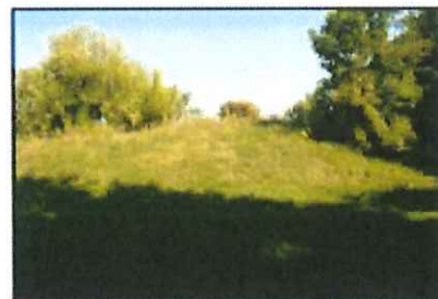
Zieliniec: Grodzisko