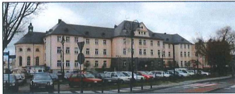
Września: Stary budynek Szpitala Powiatowego

Obiekt w strefie ochrony konserwatorskiej historycznego układu urbanistycznego miasta. Budynek wzniesiony w l. 1925-1929 wg projektu Józefa Gierczyka. Jest to budynek wielocłonowy (skrzydło główne, do niego przylegające prostopadle skrzydła boczne, skrzydło zbudowane na podstawie starego budynku szpitalnego oraz kaplica zamknięta półkoliście), na wysokim podpiwniczeniu, dwupiętrowy, kryty wysokim dachem wielopołaciowym krytym łupkiem, na dachu kaplicy wieżyczka. Elewacja frontowa osiemnastoosiowa z ryzalitem centralnym i dwoma bocznymi.