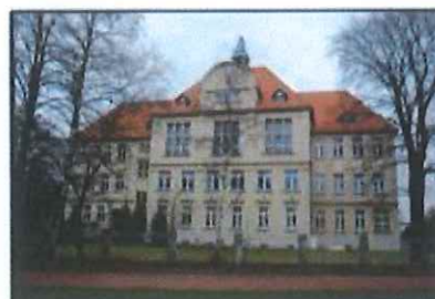
Września: Liceum Ogólnokształcące im. H. Sienkiewicza

Obiekt w strefie ochrony konserwatorskiej historycznego układu urbanistycznego miasta. Budynek zbudowany w 1911 r. wg projektu Paula Pitta z Poznania. Dwupiętrowy budynek na rzucie zbliżonym do litery U, składający się z trzech prostokątnych skrzydeł. Frontowe skrzydło wzbogacone prostokątnym ryzalitem. Budynek nakrywa wysoki dach wielopłociowy, kryty dachówką, na szczycie dachu skrzydła głównego wieżyczka wentylacyjna. Wejścia do budynku od ul. Szkolnej i od ul. Witkowskiej ujęte w portalowe obramienia.