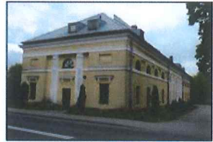
Kołaczkowo: Dawna stajnia dworska

Budynek z poł. XIX w. wchodzący w skład zespołu parkowo-palacowego. Obiekt o formach klasycystycznych nakryty dachem naczółkowym. Elewacje rozczłonkowane pilastrami ujmującymi osie okienne: prostokątne na parterze, półkoliste na piętrze. Wejścia w szczytach ujęte przyściennymi kolumnami