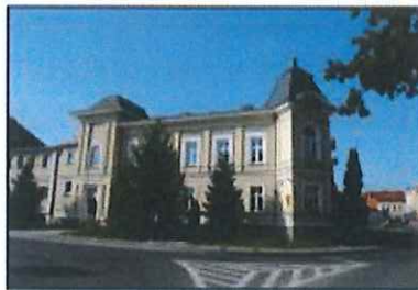
Września: Starostwo Powiatowe

Obiekt w strefie ochrony konserwatorskiej historycznego układu urbanistycznego miasta. Nie znamy dokładnej daty powstania budynku starostwa. Nastąpiło to prawdopodobnie w latach 60. XIX w. W 1912-1913 r. budynek landratury przebudowano ze środków przeznaczonych wcześniej na budowę we Wrześni nowego szpitala. Obok budynku władz powiatowych w 1913-1914 r. pobudowano willę dla starosty powiatowego (dziś budynek gminy, m.in. USC). Główne wejście do starostwa znajdowało się od ul. Ewangelickiej (3 Maja). Obok wejścia umiejscowiono balkon z czterema jońskimi kolumnami zwieńczony trójkątnym tympanonem. Ściany ubogacone były licznymi boniami, gzymsami i pilastrami. Budynek od ulicy otoczony był metalowym, kutym parkanem z murowanymi słupkami. W 1939 r. po remoncie budynku zubożono jego wielość form architektonicznych. Zlikwidowano kolumny z tympanonem, uproszczono gzymsy nadokienne i pilastry. Rozebrano parkan otaczający starostwo. W 1962 r. pobudowano łącznik pomiędzy budynkiem starostwa a dawną willą starosty tworząc jeden kompleks budynku urzędu (Chopina 9 i 10).