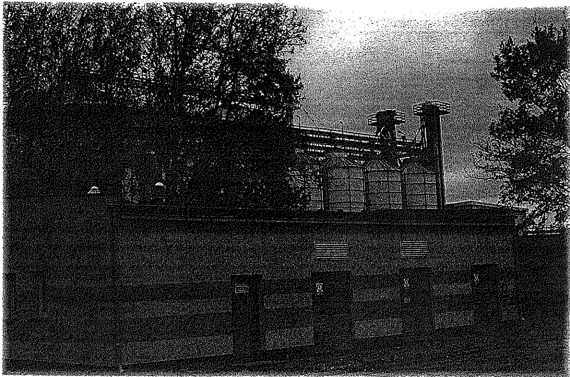
Fot. 1. OM Gierłatowo 21 – widok silosów, na których zamontowano antenę linii radiowej Emitel